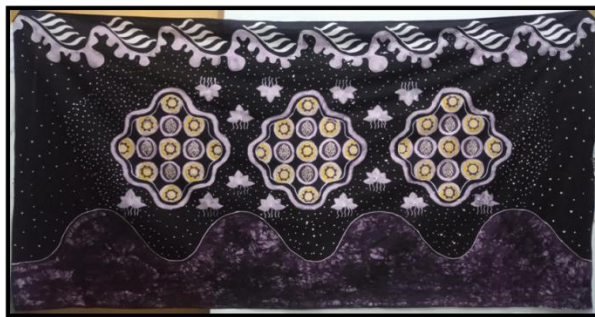
Gambar 11 Karya Batik Galaksi Perkebunan