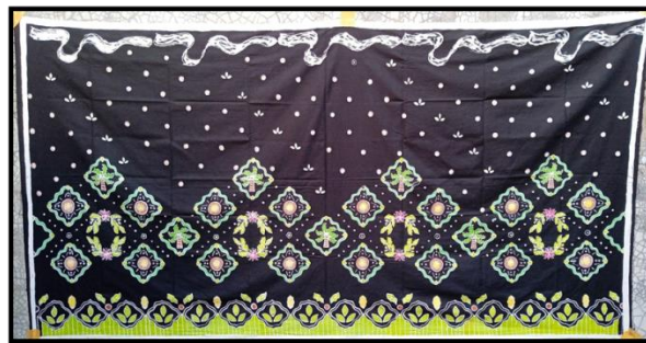
Gambar 2 Karya Batik Gerompolan Sawit