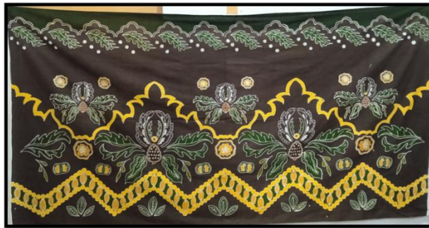
Gambar 3 Karya Batik Rimbun Raya