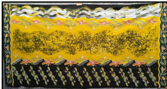
Gambar 8 Karya Batik Hampanan Emas Kebun Raya