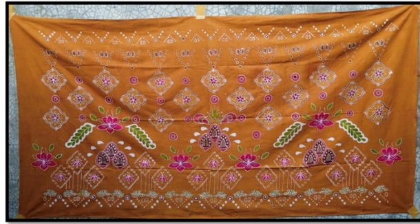
Gambar 5 Karya Batik Sekar Nusantara