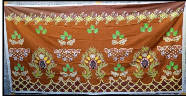
Gambar 9 Karya Baatik Pusaka Perkebunan