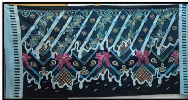
Gambar 6 Karya Batik Birama Rimbun Raya