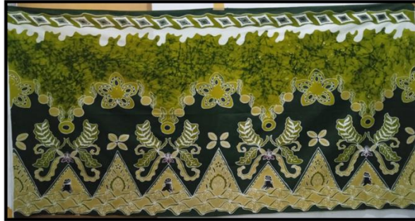
Gambar 7 Karya Batik Trisula Perkebunan Raya