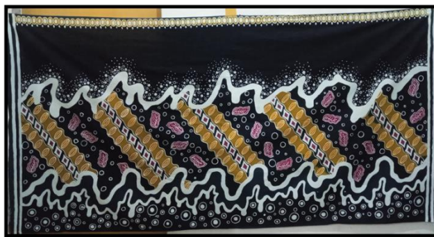
Gambar 4 Karya Batik Tri Pusaka Raya