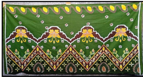
Gambar 1 Karya Batik Tri Gunungan