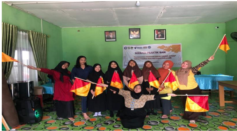
Gambar 2. Latihan Tari Kreasi Smaphore