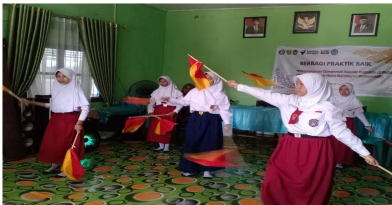
Gambar 3. Latihan tari kreasi smaphore

Peneliti menemukan bahwa pada pertemuan keempat semua siswa hadir untuk pembelajaran seni tari. siswa sangat tertarik untuk belajar tari kreasi smaphore. Mereka juga melihat guru menjelaskan menggunakan bahasa isyarat dan menunjukan beberapa jenis gerak tari. meskipun mereka memiliki keterbatasan siswa masih dapat menerima materi yang diberikan oleh guru.