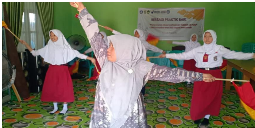
Gambar 1. Aktifitas pembelajaran seni tari kreasi smaphore

Dalam perencanaan pembelajaran seni tari agar dapat mencapai tujuan pembelajaran. Gurumenyiapakn media, dan alat penunjang dalam pembelajaran seni tari guru memulai pembelajaran dengan berdoa. Sebelum pembelajaran dimuali, guru menyiapkan media untuk membantu pembelejaran seni tari. Sebelum pelajaran dimulai, guru pertama kali mengajarkan gerakan kepada peserta didik terlebih dahulu