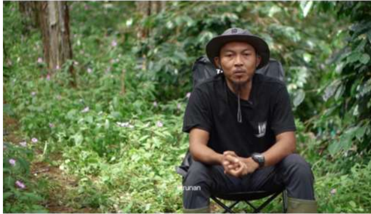
Gambar 2. Komposisi Rule Of Thirds Pada Wawancara Narasumber.

Selain rule of thirds , komposisi foreground dan background juga dimanfaatkan untuk memperlihatkan hubungan antara petani dan alam. Pada beberapa adegan, tanaman kopi ditempatkan di bagian foreground sementara petani berada di middle ground atau background . Teknik ini memberikan kesan kedalaman ruang serta memperkuat visual mengenai keterikatan petani dengan lingkungan perkebunan kopi.