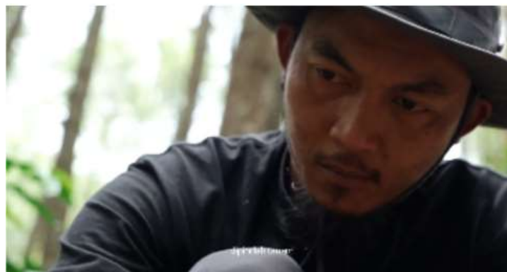
Gambar 6. Hasil Pengambilan Gambar Tilting Scene .

Tilting adalah gerakan vertikal kamera, di mana kamera bergerak ke atas atau ke bawah. Teknik ini digunakan untuk memperlihatkan objek yang berada di posisi tinggi maupun rendah, seperti bangunan tinggi atau pemandangan dari area perbukitan. Gerakan tilting juga dapat memberikan sudut pandang yang lebih menarik serta menambah kesan kedalaman pada visual. Selain itu, teknik ini sering dipakai untuk menampilkan atau mengungkap detail penting yang sebelumnya belum terlihat oleh penonton (Utomo, T. (2024, Juli).