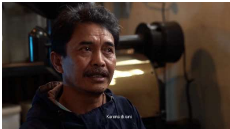
Gambar 4. Teknik Still Shot Pada Scene Wawancara.

Teknik simple shot digunakan untuk mewujudkan aspek informasi dengan pengambilan gambar yang diam atau still (Azizah, H. N. (2021)). Pada pembuatan video feature Kopi Manglayang: Nafas Petani dari Lereng Gunung, teknik ini digunakan pada saat pengambilan gambar wawancara narasumber.