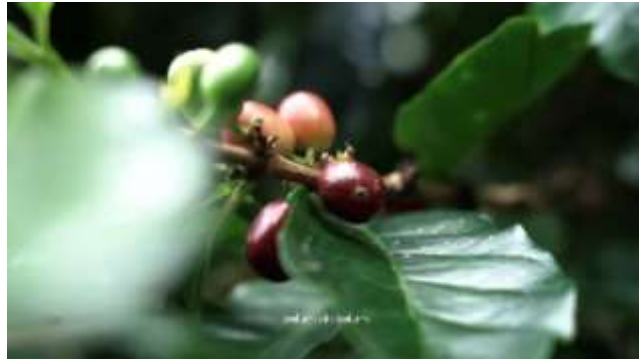
Gambar 7. Hasil Pengambilan Gambar Push In .

digunakan agar detail dan ekspresi objek terlihat lebih jelas, membangun kedekatan emosional, serta memberikan kesan dramatis pada adegan.