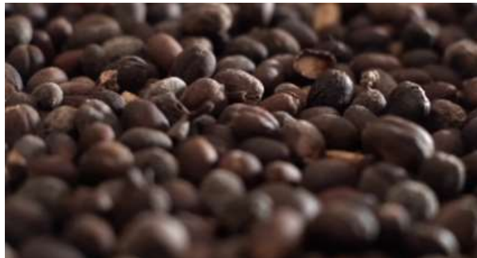
Gambar 5. Hasil Pengambilan Gambar Panning Scene

Menurut (Derajat, D, 2025).Teknik panning dalam sinematografi adalah gerakan horizontal kamera yang mengikuti pergerakan subjek atau memperlihatkan ruang secara lebih luas.