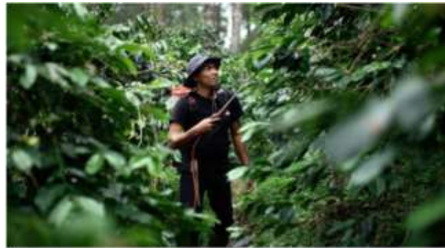
Gambar 3. Komposisi Foreground Pada Visual Aktivitas Petani.

Selain rule of thirds , komposisi foreground dan background juga dimanfaatkan untuk memperlihatkan hubungan antara petani dan alam. Pada beberapa adegan, tanaman kopi ditempatkan di bagian foreground sementara petani berada di middle ground atau background . Teknik ini memberikan kesan kedalaman ruang serta memperkuat visual mengenai keterikatan petani dengan lingkungan perkebunan kopi.