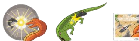
Gambar 3. Stiker

Perancangan media pendukung stiker menggunakan asset ilustrasi yang telah ada yaitu ilustrasi yang terdapat pada buku ilustrasi. Stiker berukuran 8x8 cm. stiker nantinya dikhususkan untuk menambah ketertarikan anak dengan buku, juga sebagai media promosi.