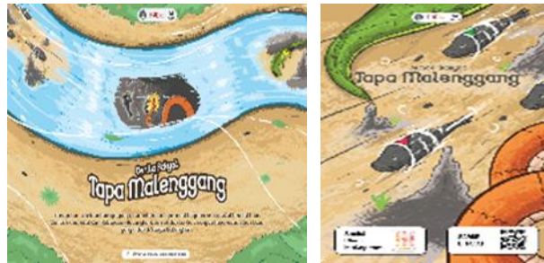
Gambar 2. Poster

Poster ini dirancang berfungsi sebagai media informasi kepada khalayak umum namun dengan target utama anak smp sebagai media sarana ajakan untuk mengenal cerita rakyat Tapa Malenggang. Pada poster pertama berisi ilustrasi sungai Batanghari sebagai latar dari cerita Tapa Malenggang dan terdapat penjelasan singkat dari cerita rakyat tapa malenggang. Pada poster kedua berisi ilustrasi cover buku cerita rakyat tapa malenggang dan barcode buku e-book serta sosial media Instagram ntuk memudahkan mengakses buku ini.