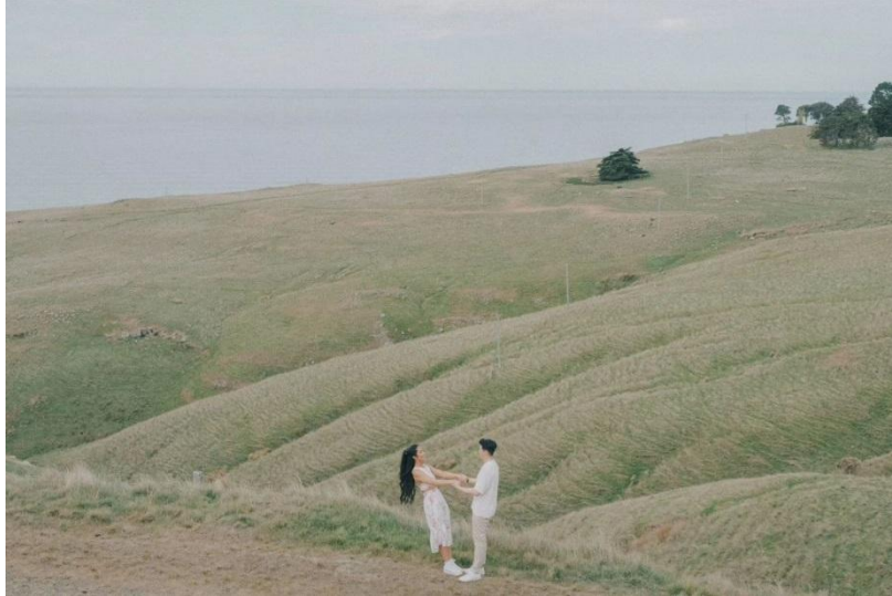
Gambar 3. “postcards from Christchurch.”

cinta itu tidak selalu mulus, tetapi tetap jadi sesuatu yang layak diperjuangkan. Foto ini tidak cuma momen, tapi juga kisah yang bisa dirasakan siapa saja yang melihatnya.