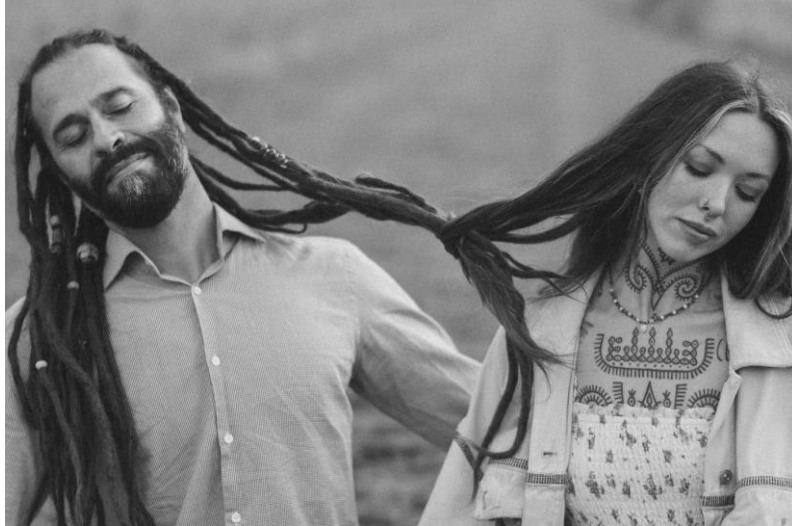
Gambar 2. “the photograph vs the process.”

tulus dan komitmen yang kuat, yang relevan dengan banyak orang. Dengan cara ini, foto ini tidak hanya menarik secara visual, tetapi juga mengandung makna yang mendalam dari segi budaya.