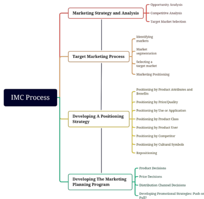
1 Presented with XMind Gambar 1. Urutan Proses Integrated Marketing Communication