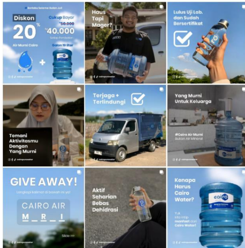
Gambar 10. Final Desain Postingan Instagram feed, Facebook dan Tiktok post.