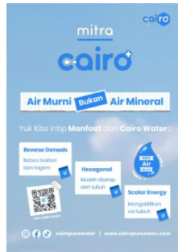
Gambar 8. Final Desain Poster