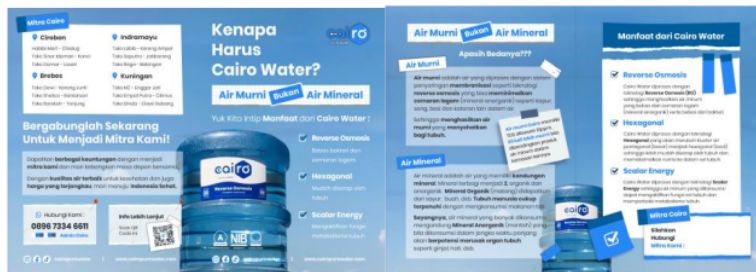
Gambar 6. Final Desain Brosur