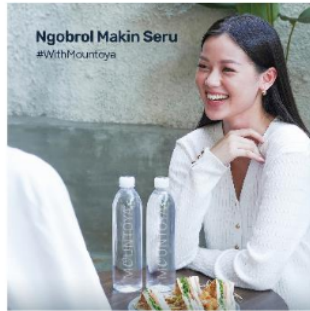
Gambar 5. Referensi Model Ilustrasi Foto