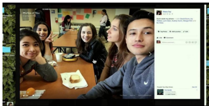
Gambar 2. Margot terlihat duduk sendiri dan tidak berswafoto bersama teman-temannya

Beberapa adegan dalam film memperlihatkan bagaimana hubungan Margot dan David Kim di dunia nyata tidak begitu hangat seperti di dunia maya, kecanggungan terlihat pada menit ke 39:09 (dalam sekuen). Margot dalam dunia sosial nyata juga dikenal sebagai pribadi yang suka menyendiri, jarang bersosialisasi dan tidak suka bercerita.