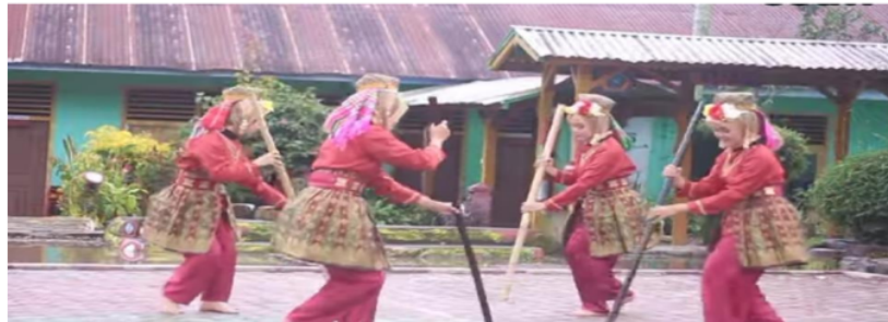
Gambar Gerak Menumbuk Padi

Gerakan ini dilakukan penari secara bergantian mulai dari penari sebelah kanan dengan berjongkok dan kaki di jinjit seraya tangan seperti mengambil padi, dan penari kiri dengan posisi mengangkat.