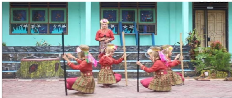
Gambar Gerak Mengeluarkan Padi dari lesung

Gerakan ini dengan posisi tangan memegang antan dengan tangan kanan lebih tinggi dari tangan kiri, dengan posisi kaki ditekuk sambal menutukan antan.