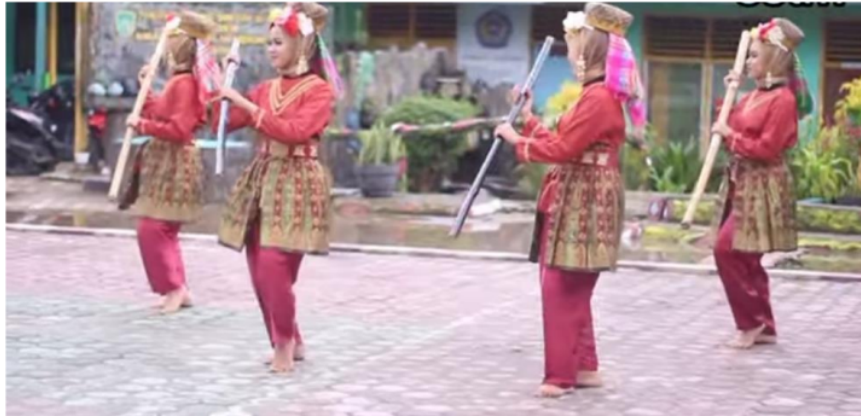
Gambar Gerak Dzikir Hadrah

Hasil dokumentasi struktur gerak tari Anak Tengah yang telah dilakukan oleh penulis di Sanggar Seni Tuah Merindu Kecamatan Pulau Beringin Kabupaten OKU Selatan berikut: