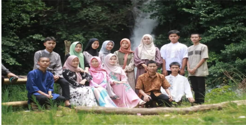
Gambar Foto Bersama Pembina Sanggar

gerakan yang keluar dari koreografi menarik perhatian bagi penonton. Tarian Anak Tengah sendiri ditarikan oleh para pelajar baik dari Sekolah Menengah Pertama (SMP), maupun Sekolah Menengah Atas (SMA) dan berlatih di Sanggar Seni Tuah Merindu.