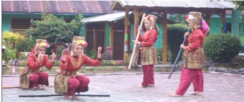
Gambar Gerak Menimbun Padi

Gerakan ini dilakukan penari secara bergantian mulai dari penari sebelah kanan dengan berjongkok dan kaki di jinjit seraya tangan seperti mengambil padi, dan penari kiri dengan posisi mengangkat.