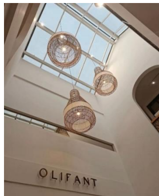
Gambar 8. Sky ligh

Elemen sky light di atas area foto memperkuat aspek ini. Pencahayaan alami yang masuk dari atas menciptakan kesan dramatis dan memperjelas tekstur serta warna dekorasi yang digunakan. Ini sejalan dengan teori “atmosphere in architecture” dari Peter Zumthor, yang menekankan pentingnya pencahayaan alami dalam membentuk kesan emosional ruang. Selain indoor, Olifant Café juga menawarkan ruang outdoor yang dirancang dengan pendekatan minimalis tropikal. Ruang luar ini tidak terlalu luas, tapi mampu menciptakan suasana yang menyegarkan berkat penataan elemen yang sederhana namun tepat guna.