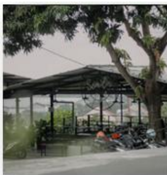
Gambar 1. Semilir Caffe

Di era sekarang kafe sudah tidak jarang di temui, terkhusus di wilayah perkotaan, area kampus, dan di area yang memiliki suasana alam yang mendukung seperti Pantai dan pegunungan. Adanya customer juga bukan hanya ditentukan oleh produk yang ditawarkan, tetapi suasana lingkungan dan desain bangunan juga berperan sebagai daya tarik tersendiri. Dengan ini juga bisa dijadikan indikator peningkatan konsumtif bagi Masyarakat (Wardani 2012). Hasil dari observasi ini mengambil contoh dari beberapa kafe yang berada di wilayah kota semarang.