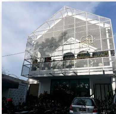
Gambar 4. Olifant house

Contoh kedua diambil dari olifant house yang berlokasi di JL. Pleburan Barat No.16, Semarang Café ini menampilkan perpaduan antara desain modern dan kenyamanan fungsional. Dengan dua lantai yang mencakup area indoor dan outdoor, kafe ini dirancang untuk memberikan pengalaman bersantai yang menyenangkan bagi pengunjung(Soft 2023).