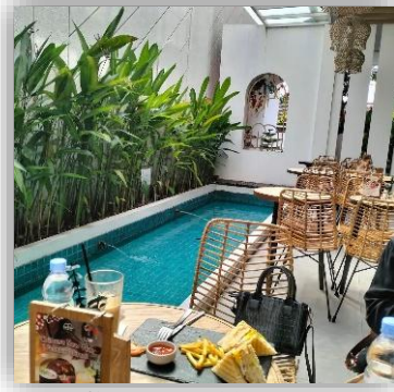
Gambar 10. Outdoor

Salah satu elemen utama di area outdoor adalah kolam memanjang yang diletakkan di sisi area duduk. Kolam ini tidak hanya berfungsi sebagai elemen dekoratif, tetapi juga menciptakan suasana tenang dan rileks memberikan efek psikologis para pengunjung agar betah (Umum et al. 2016).