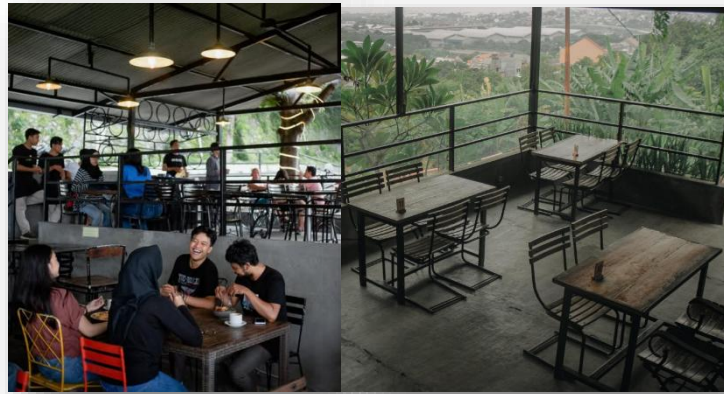
Gambar 2. Penggunaan split level di semilir caffe

Dari sisi fungsional, Semilir Caffe menyediakan area duduk yang tertata nyaman dengan jalur sirkulasi antar ruang yang tertata rapi dan mudah diakses. Penggunaan sistem split level bukan hanya untuk mengikuti kemiringan lahan, tetapi juga membentuk zonasi ruang secara alami tanpa harus menggunakan sekat masif. Dengan itu estetika tetap ada dengan cara memanfaatkan fungsi dari lahan yang berkontur miring. Pengunjung pun diberi kebebasan untuk memilih posisi duduk sesuai suasana yang diinginkan, baik yang dekat dengan area taman, menghadap langsung ke pemandangan perbukitan, ataupun yang menawarkan nuansa lebih tenang dan privat.