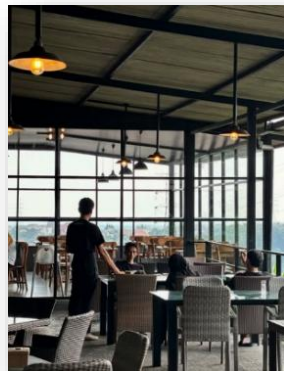
Gambar 3. Desain outdoor dari semilir caffe

Dari aspek gaya, Semilir Caffe menerapkan pendekatan desain tropis terbuka (tropical outdoor) dengan memanfaatkan lokasi yang strategis menjadi bagian dari salahsatu marketing kafe ini(Adzkiah 2025). Desain bangunan caffe ini juga sangat menonjolkan kesan alami dan menyatu dengan lingkungan. Elemen-elemen seperti material kayu, batu alam, vegetasi yang rimbun, serta pencahayaan hangat berperan besar dalam menciptakan atmosfer yang santai dan mengundang. Keindahan alam sekitar, seperti hamparan perbukitan di siang hari dan city light saat malam.