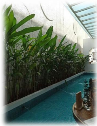
Gambar 9. Ruang outdoor

Elemen sky light di atas area foto memperkuat aspek ini. Pencahayaan alami yang masuk dari atas menciptakan kesan dramatis dan memperjelas tekstur serta warna dekorasi yang digunakan. Ini sejalan dengan teori “atmosphere in architecture” dari Peter Zumthor, yang menekankan pentingnya pencahayaan alami dalam membentuk kesan emosional ruang. Selain indoor, Olifant Café juga menawarkan ruang outdoor yang dirancang dengan pendekatan minimalis tropikal. Ruang luar ini tidak terlalu luas, tapi mampu menciptakan suasana yang menyegarkan berkat penataan elemen yang sederhana namun tepat guna.