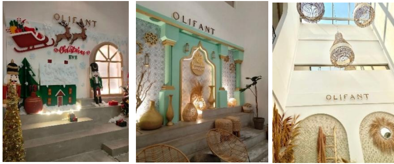
Gambar 7. Skylight olifant house