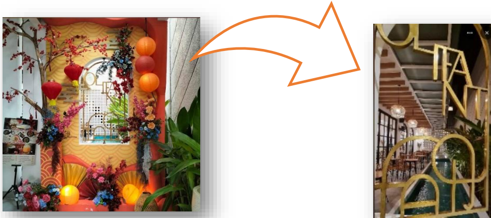
Gambar 5. Dekorasi olifant house

kolam memberikan Kesan frist impression yang mewah untuk para pengunjung. Dengan bertuliskan olifant memberikan karaktaresitik yang mendalam. Terlebih lagi sering di jadikan spot foto pengunjung, karna di setiap event ada dekorasi sedemikian rupa, sehingga pengunjung tidak akan bosan untuk mengunjungi café ini.