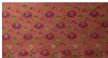
Hasil karya batik tulis 9