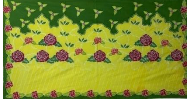
Hasil karya batik tulis 10