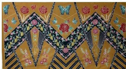
Hasil karya batik tulis 7