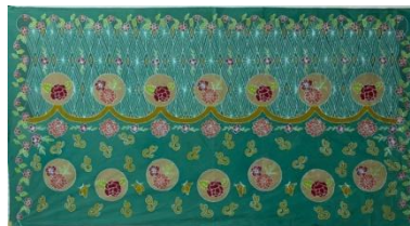
Hasil karya batik tulis 5