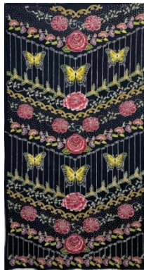
Hasil karya batik tulis 8