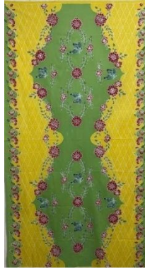
Hasil karya batik tulis 12