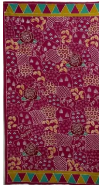
Hasil karya batik tulis 4