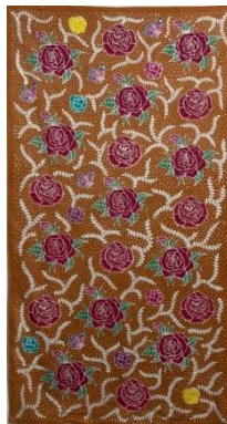
Hasil karya batik tulis 1