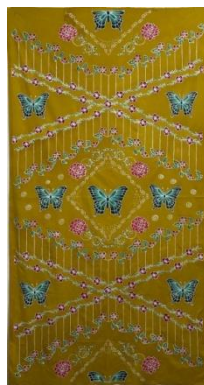
Hasil karya batik tulis 3