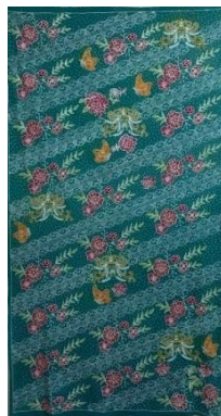
Hasil karya batik tulis 11