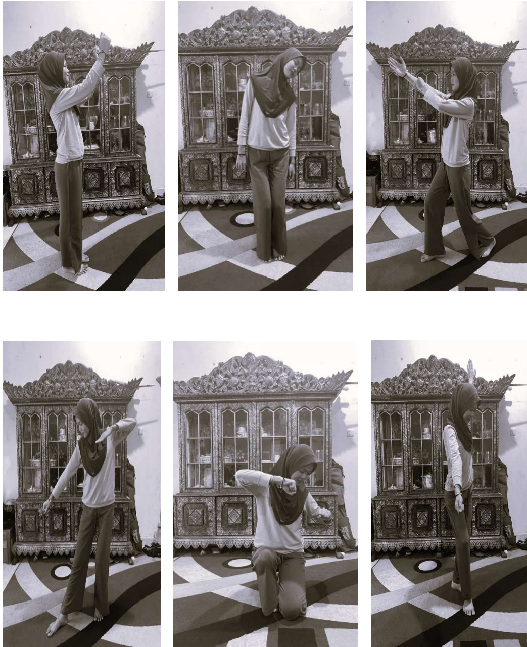
Gambar Gerak Tari Manggang Kemplang

Mode penyajian tari Manggang Kemplang yaitu mode penyajian simbolik yang mana dinyatakan berdasarkan gerakan gerak tari yang memiliki makna seperti gerak memanggang kemplang .