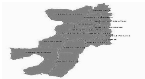
Gambar 1. Peta Kabupaten Ogan Ilir

Ogan ilir adalah salah satu Kabupaten di Provinsi Sumatera Selatan. Ibu kota Ogan Ilir berada di kecamatan Indralaya. Kabupaten ini merupakan pemekaran dari Kabupaten Ogan Komering Ilir. Lokasi penelitian ini bertempat di Sanggar Kipas Emas kelurahan Timbangan kecamatan Indralaya Utara Kabupaten Ogan Ilir.