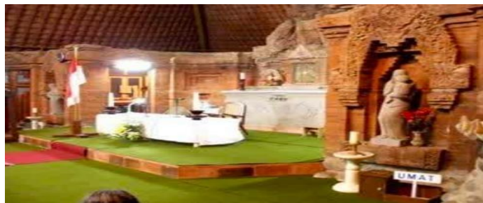
Gambar 5. Interior Pada Bangunan Gereja Puhsarang.

Adanya undakan (signifier) yang memisahkan antara bagian pelataran mimbar altar dengan tempat ibadah para jemaat gereja, menegaskan perbedaan fungsi dari masing-masing ruang yang terbentuk secara tidak langsung. Dengan adanya undakan yang lebih tinggi ini secara langsung dapat ditangkap oleh pengamat bahwa adanya perbedaan level yang dapat diartikan sebagai perbedaan fungsi, dan secara tidak langsungnya dapat diartikan bahwa yang lebih tinggi (altar) digunakan oleh yang memimpin jalannya peribadahan. Pembacaan ini dapat digolongkan ke dalam semiotik pragmatik karena efek dari tanda (undakan) tersebut mempengaruhi penggunaannya.