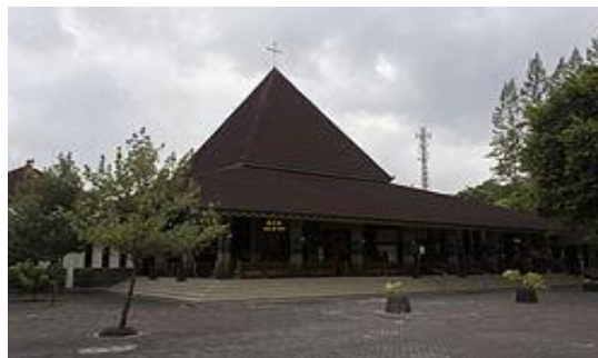
Gambar 3. Gereja tradisi berupa gereja hati kudus yesus Ganjuran, Bantul, Indonesia.