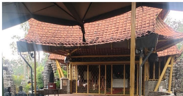
Gambar 9. Tempat Peribadatan Pada Gereja Puhsarang.