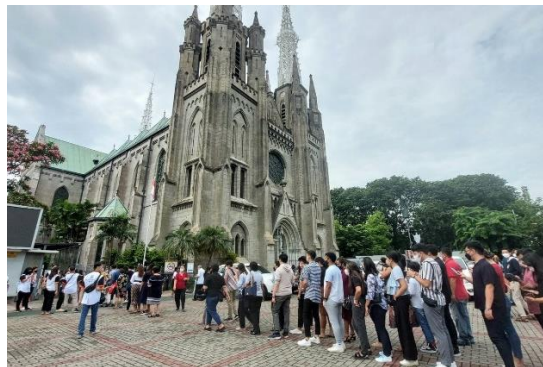
Gambar 2. Gereja gothic berupa Gereja Katedral Jakarta.