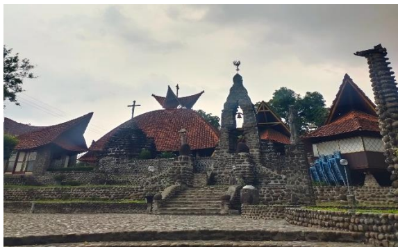
Gambar 6. Eksterior Pada Bangunan Gereja Puhsarang.