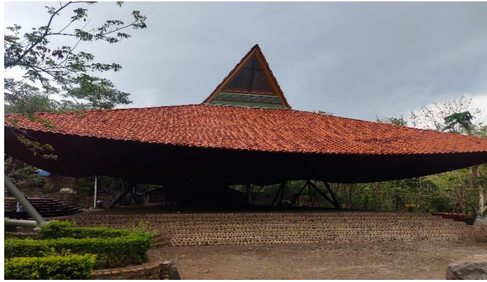
Gambar 7. Bangunan Ibadah Pendukung Pada gereja Puhsarang.