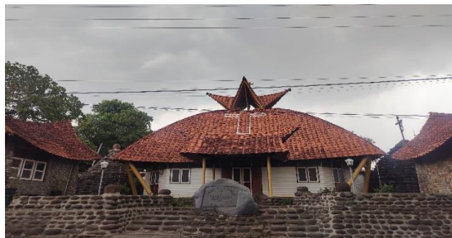
Gambar 8. Atap Pada Bangunan Utama Gereja Puhsarang.

Atap pada bangunan utama gereja puhsarang memiliki bentuk yang cukup unik. Bentuk atap pada bangunan ini berbentuk kubah yang berbeda pada umumnya yang berbentuk simetris dengan lengkungan halus. Namun atap pada bangunan ini lebih menganut gaya arsitektur masa romawi kuno yang ditandai dengan bentuk kubah yang tidak menjulang namaun sedikit datar. Hal tersebut dapat kalian lihat pada gambar.