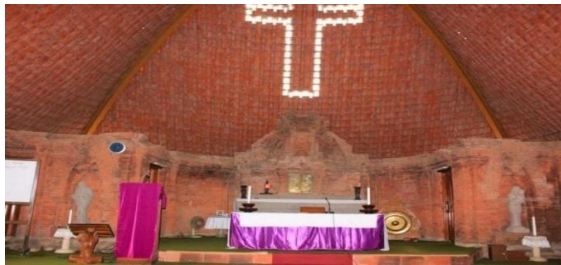
Gambar 4. Interior Pada Bangunan Gereja Puhsarang.