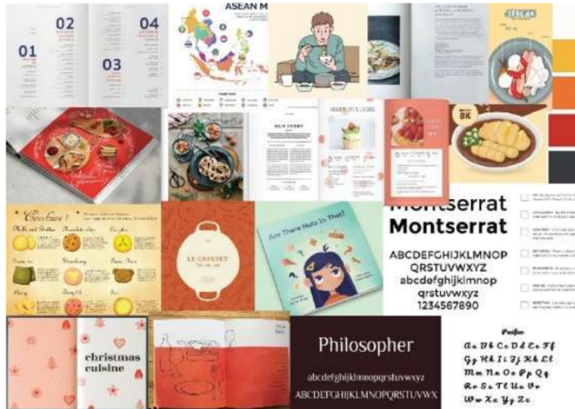
Gambar 7. Moodboard