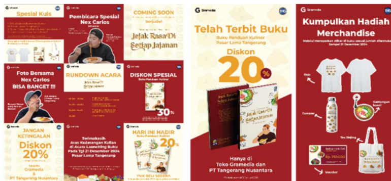
Gambar 12. Karya Pendukung