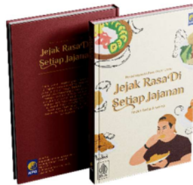
Gambar 10. Buku Panduan Kuliner