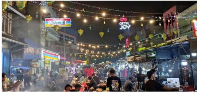
Gambar 1. Pasar Lama Tangerang

satu daya tarik utamanya adalah wisata kuliner di Pasar Lama Tangerang, yang terkenal dengan warisan budaya kawasan Cina Benteng, menarik banyak pecinta kuliner (Apipah & Widyastuti, 2023). Menurut data BPS Kota Tangerang, pada tahun 2018 terdapat 57 destinasi wisata di kota ini. Pasar Lama Tangerang adalah yang paling sering dikunjungi, terkenal dengan beragam street food yang lezat dan terjangkau dibandingkan pasar lainnya (Suharjono, 2022).