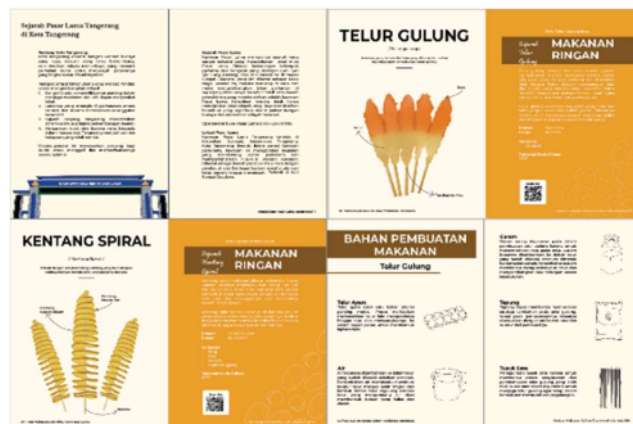
Gambar 11. Isi Buku Panduan Kuliner

Tampilan isi buku panduan kuliner berjudul Petualangan Kuliner Pasar Lama Tangerang Jejak Rasa Di Setiap jajanan terdiri dari setiap bab awal sampai akhir yang diwakili beberapa yang ditampilkan dibagian bawah: