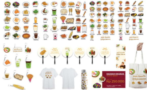
Gambar 13. Merchandise

Penulis membuat media pendukung berupa feeds Instagram, story Instagram, poster, roll banner , web banner dan flye . Untuk mempromosikan produk buku kepada pembaca, media pendukung akan dicetak pada saat pre-launching, launching buku, dan pasca-launching.