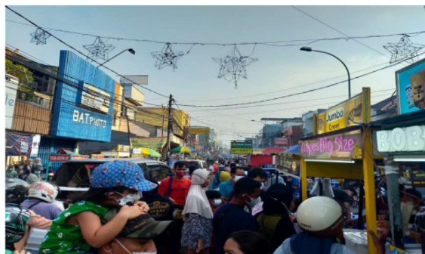
Gambar 2. Aktivitas Pasar Lama Tangerang

Pasar Lama, salah satu ikon Tangerang, pertama kali dibangun pada masa Hindia Belanda tahun 1810. Renovasi dan perbaikan dilakukan antara tahun 1970–1990 untuk meningkatkan fasilitas pasar. Dahulu, Pasar Lama merupakan pemukiman masyarakat Tionghoa, yang juga dikenal sebagai Cina Benteng (Marxalim & Anggraini, 2023). Lokasinya yang strategis menyediakan beragam produk makanan dan minuman yang dijual oleh pedagang kaki lima dengan cara yang unik (Sakya Wijaya & Soelaiman, 2023). Minat pengunjung semakin meningkat karena pemerintah Kota Tangerang memanfaatkan peluang untuk mempromosikan dan memperkenalkan Kawasan Pasar Lama, salah satunya melalui acara "Pasar Lama Culinary Night".