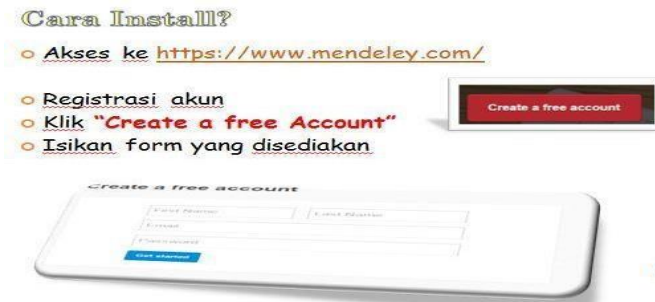
Gambar 4. Cara akses Mendeley

Berdasarkan pengalaman yang terjadi dilapangan, kesalahan yang paling banyak dilakukan oleh penulis dari kalangan mahasiswa adalah pada saat mengutip suatu artikel, namun kemudian menuliskan nama penulis yang dikutip pemilik naskah dengan memasukkan namanya yang tertera dalam daftar pustaka. Padahal, sering terjadi pemilik naskah sudah merubah redaksional dari bagian yang dikutip, sehingga tidak sama persis dengan kalimat yang dikutipnya. Kesalahan seperti ini yang harus diperbaiki oleh mahasiswa dengan dibekali pengetahuan tentang teknik pengutipan secara umum ataupun yang disesuaikan dengan teknik yang digunakan oleh kampus masing-masing. Sebab, suatu perguruan tinggi memiliki ketentuan tersendiri tentang teknik kutipan yang berlaku di perguruan tinggi masing-masing, sehingga selain menguasai perangkat lunak mendeley sangat penting juga bagi mahasiswa untuk memperhatikan teknik kutipan yang berlaku sebelum membuat kutipan.