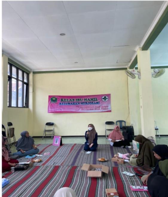
Gambar 2. Pelaksanaan Kegiatan

7 Kegiatan penyuluhan fisioterapi mengenai low back pain pada ibu hamil dengan metode massage dan stretching di kelurahan merjosari Malang berjalan baik dan lancar dengan mendapatkan respon yang baik dari para peserta kelas ibu hamil saat penyuluhan berlangsung, peserta kelas ibu hamil berjumlah 12 orang. Para peserta sangat antusias dan mendengarkan secara seksama terhadap materi yang disampaikan, yaitu definisi, gejala, penyebab serta cara mengatasi low back pain pada ibu hamil. Selain itu juga materi yang disampaikan sangat menarik karena didukung dengan media promosi berupa selebaran dengan mencantumkan gambar serta demonstrasi cara melakukan teknik massage dan stretching yang dapat dilakukan di rumah secara mandiri maupun di bantu oleh keluarga. Kemudian setelah penyampaian materi dilakukan diskusi tanya jawab antara pemati dan peserta. Pertanyaan yang disampaikan oleh peserta cukup menarik sehingga diskusi dapat memperdalam materi dan ilmu pengetahuan baru bagi peserta.