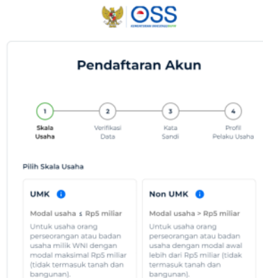
Gambar 4. Pendaftaran Akun