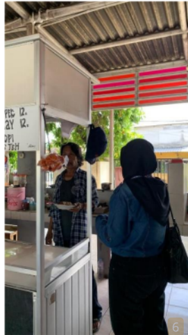
Gambar 1. Observasi Dan Wawancara Dengan Pelaku Usaha di Sentra Wisata Kuliner Penjaringansari

Setelah melakukan wawancara dengan para pelaku usaha di Sentra Wisata Kuliner Penjaringansari, diperoleh data sebagai berikut :