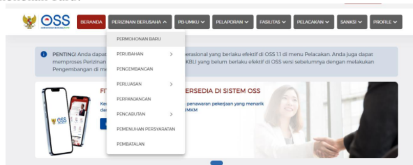
Gambar 6. Tampilan Untuk Permohonan Baru