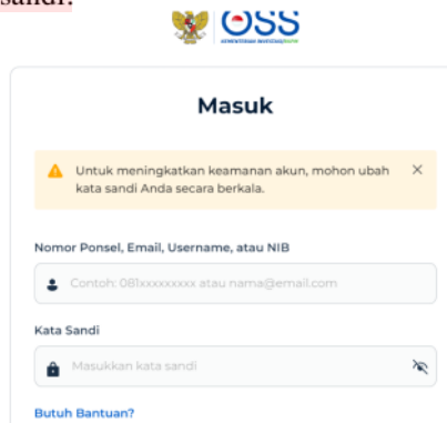
Gambar 5. Tampilan Masuk Akun OSS