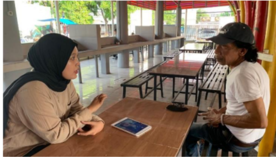
Gambar 2. Pemberian Edukasi Pentingnya Nomor Induk Berusaha

belum memiliki Nomor Induk Berusaha ini akan diberikan edukasi secara langsung tatap muka terkait pengertian, manfaat, proses pendaftaran, dan persyaratan yang dibutuhkan pada saat pembuatan Nomor Induk Berusaha.