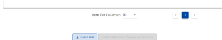
Gambar 8. Tahap terakhir Pembuatan NIB