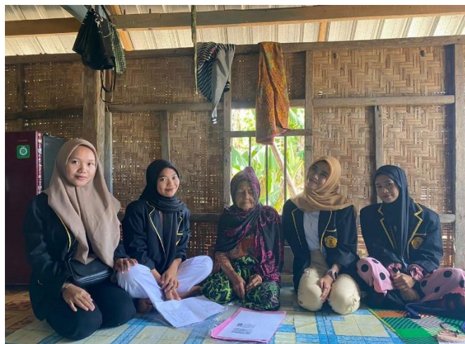
Gambar 1 . Dokumentasi Kegiatan Pengabdian Masyarakat

Banyak orang menganggap diabetes sebagai penyakit serius yang dapat berdampak negatif terhadap kualitas hidup seseorang. Namun, ada kabar baik: diabetes bisa berkembang. Mungkin diabetes sebaiknya diresepkan bagi mereka yang tidak mampu mengendalikannya. Diabetes adalah kelainan kromosom yang disebabkan oleh kelainan pada fungsi pankreas sehingga mempengaruhi produksi insulin atau ketidakmampuan tubuh menggunakan insulin secara efektif. Beberapa gejala bahwa seseorang mengalami diabetes, antara lain: Ekskresi Urin