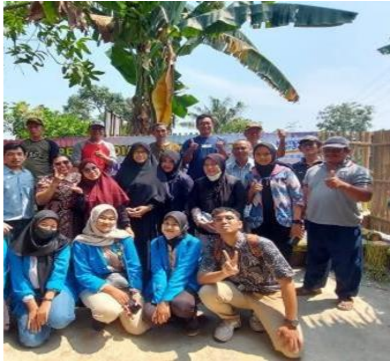
Gambar 3. Peserta dan Anggota Kelompok PM