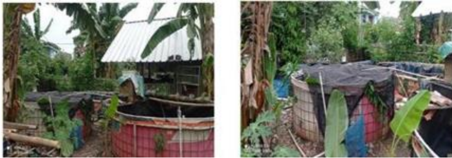
Gambar 2 . Tempat Usaha Lele Kelompok PM

Untuk meningkatkan pengetahuan dan kemampuan anggota kelompok tani lele maka hal yang dilakukan antara lain. Anggota kelompok tani diperkenalkan dengan fitur-fitur utama Facebook seperti halaman ( Facebook Page ), grup, dan fitur iklan. Mereka memahami bagaimana platform ini dapat digunakan untuk berkomunikasi dengan pelanggan potensial dan mempromosikan produk secara efektif. Diberikan panduan tentang strategi-strategi yang dapat digunakan untuk membuat konten yang menarik, relevan, dan dapat meningkatkan interaksi dengan pengguna Facebook . (Hendrawan et al. , 2019) Selanjutnya membuat dan mengenalkan langkah-langkah praktis dalam membuat dan mengelola halaman Facebook untuk usaha budidaya lele. Termasuk di dalamnya adalah pengaturan privasi, informasi kontak, dan penulisan deskripsi yang menarik.