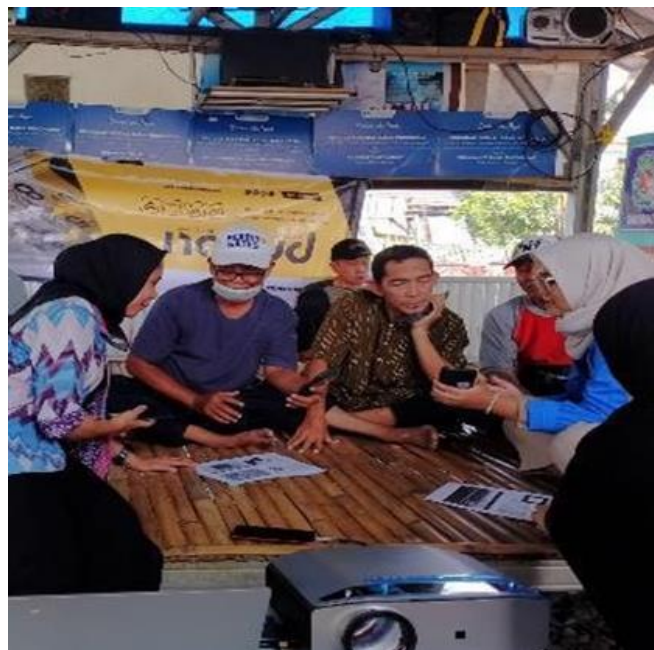
Gambar 4 Kegiatan PM sosialisasi Penggunaan Facebook, Peserta Anggota Kelompok Sosialisasi dan Belajar Penggunaan Facebook