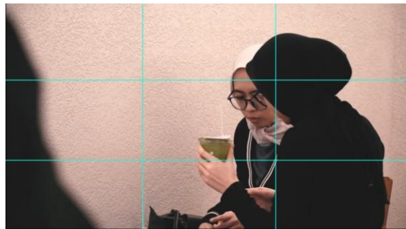
Gambar 11. Rule Of Thirds.

Rule of thirds merupakan prinsip komposisi yang membagi frame menjadi sembilan bagian melalui dua garis horizontal dan dua garis vertikal (Bowen, 2018). Posisi ini menempatkan wajah dan aktivitas konsumsi matcha sebagai fokus utama, sementara ruang kosong di sisi kiri dimanfaatkan sebagai negative space yang membantu menyeimbangkan komposisi. Rahima (2025) menyatakan bahwa penerapan rule of thirds yang memanfaatkan negative space sebagai elemen penyeimbang terbukti mampu menciptakan tampilan yang lebih dinamis sekaligus memudahkan penonton dalam memahami aktivitas yang sedang berlangsung dalam frame.