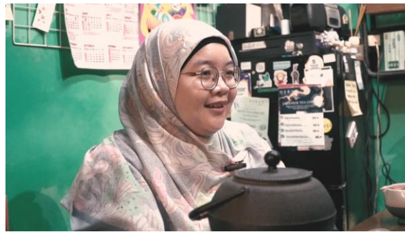
Gambar 1. Eye Level.

menciptakan kesan netral dan natural. Sudut ini diterapkan pada wawancara narasumber di dalam kafe untuk menghadirkan komunikasi yang terasa setara dan dekat antara narasumber dengan penonton. Penggunaan sudut kamera sejajar dengan pandangan mata subjek mampu menghadirkan kesan objektif dan menempatkan penonton pada posisi yang setara sehingga informasi yang disampaikan dapat diterima secara langsung tanpa adanya penekanan visual tertentu (Pratista, 2017).