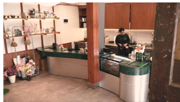
Gambar 2. High Angle.

High angle merupakan sudut kamera yang ditempatkan lebih tinggi dari subjek sehingga mengarah ke bawah. High angle digunakan untuk menampilkan keseluruhan area kafe dari posisi yang lebih tinggi, sehingga penonton dapat memahami tata ruang, posisi barista, serta hubungan antar elemen dalam lingkungan tersebut. Sudut ini digunakan untuk menampilkan konteks ruang lebih luas serta hubungan subjek dengan lingkungannya (Pratista, 2017).