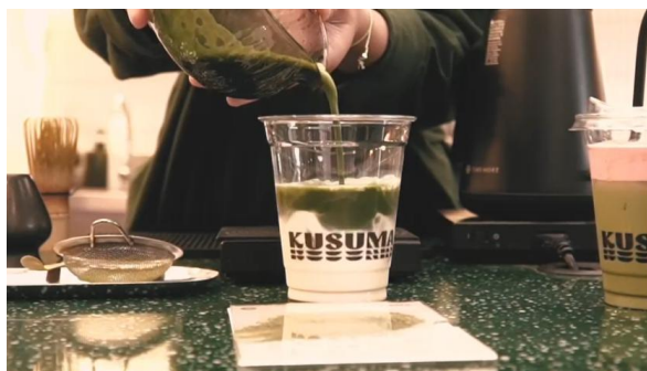
Gambar 9. Close Up.

menyatakan bahwa close up berfungsi untuk mengarahkan perhatian penonton terhadap detail maupun konteks ruang, sehingga pesan visual dalam dokumenter dapat tersampaikan secara komunikatif dan estetik.