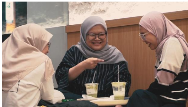
Gambar 7. Medium Shot.

matcha, di mana setiap kelompok memiliki cara tersendiri dalam menikmati matcha, baik melalui percakapan santai maupun momen kebersamaan yang lebih intim. Menurut Alfariy dan Muhammad (2024), medium shot efektif digunakan karena mampu memperlihatkan ekspresi wajah serta gerakan tangan seseorang secara lebih jelas, sehingga audiens seolah merasa berada pada posisi yang sejajar dengan subjek yang ditampilkan.