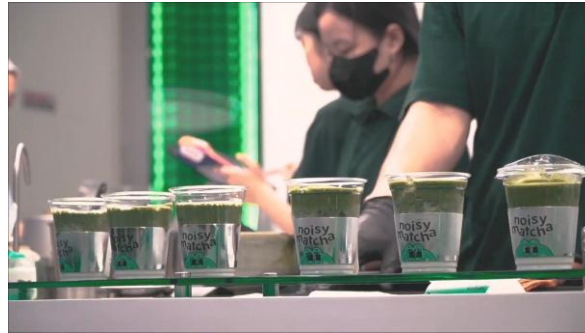
Gambar 3. Low Angle.