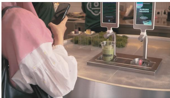
Gambar 10. Over The Shoulder.

Over the shoulder merupakan sudut pandang kamera yang menempatkan kamera di belakang bahu salah satu subjek sehingga sebagian bahu atau tubuh subjek terlihat dalam frame. Sudut ini menempatkan kamera di belakang bahu subjek yang sedang merekam momen penyajian matcha melalui dispenser yang menciptakan kesan seolah-olah penonton berada dalam posisi yang sama. Samtrimandasari (2023) menyatakan bahwa penempatan over the shoulder , memungkinkan penceritaan yang lebih terbatas sekaligus membangun keterlibatan penonton secara lebih langsung terhadap peristiwa yang terjadi dalam frame.