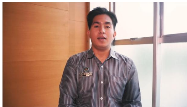
Gambar 4. Still.

Still merupakan kondisi kamera berada pada posisi stabil tanpa pergerakan saat perekaman. Penerapan teknik ini berfungsi menegaskan informasi serta menjaga konsentrasi penonton pada isi pesan yang menjadi bagian penting dalam struktur naratif dokumenter, terutama pada sesi wawancara narasumber. Penggunaan still membantu mengarahkan perhatian penonton secara penuh kepada subjek selama proses perekaman (Prabowo, 2020).