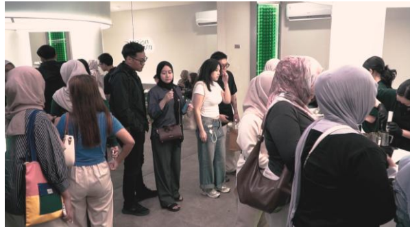
Gambar 5. Handheld.

menciptakan kesan yang lebih alami dan emosional, khususnya dalam adegan yang membutuhkan fleksibilitas mengikuti aktivitas yang berlangsung secara spontan.