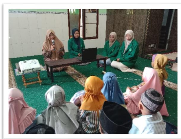
Gambar 2. Sambutan dan Dukungan Pihak Pengelola TPQ terhadap Program PKM.

Zaleha et al. (2025) menyatakan bahwa lingkungan yang kondusif, termasuk aspek fisik dan fasilitas, memegang peranan krusial dalam mendukung praktik keagamaan yang mampu memberikan efek relaksasi dan ketenangan batin bagi individu. Berdasarkan hasil observasi pada Gambar 1, TPQ Miftakhul Huda yang terletak di desa Keboananom, Gedangan, memiliki kondisi geografis yang strategis dan mendukung kenyamanan proses belajar mengajar bagi para santri. Fasilitas yang tersedia, khususnya area pengambilan air wudhu yang memadai, menjadi instrumen utama dalam pelaksanaan program pembiasaan doa sebelum dan sesudah wudhu. Kegiatan tahap awal telah dilaksanakan secara komprehensif, sehingga tujuan pertama dalam fase discovery yakni mengidentifikasi potensi lingkungan dan kesiapan sarana prasarana lembaga untuk penanaman karakter religius melalui praktik wudhu telah berhasil tercapai sepenuhnya sesuai rencana kegiatan PKM.