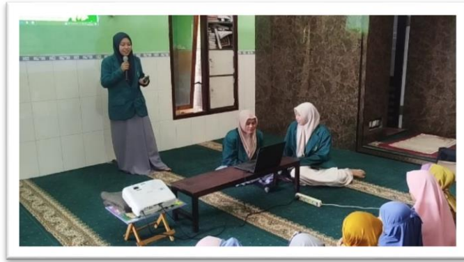
Gambar 3. Penyampaian Materi Doa Wudhu Kreatif oleh Tim Mahasiswa PKM.

Penyampaian materi doa wudhu secara kreatif oleh tim mahasiswa PKM merupakan langkah strategis untuk mentransformasi rutinitas fisik menjadi pengalaman spiritual yang bermakna bagi para santri. Dalam fase design , tim pengabdian telah berhasil merancang dan menetapkan kurikulum pembiasaan doa wudu yang terintegrasi ke dalam aktivitas harian sebagai standar operasional pendidikan karakter di TPQ Miftakhul Huda. Keberhasilan pencapaian tujuan ini terlihat dari tingginya antusiasme serta peningkatan pemahaman santri terhadap makna spiritual di balik setiap doa, sehingga visi untuk menanamkan karakter religius melalui praktik ibadah harian telah terealisasi sesuai dengan perencanaan program (Naya & Anggrainy, 2023). Pendekatan interaktif ini menegaskan bahwa pembentukan karakter religius paling efektif dilakukan melalui metode pembiasaan praktik ibadah yang dirancang secara menyenangkan. Dengan demikian, implementasi strategi kreatif ini tidak hanya meningkatkan kemampuan motorik anak, tetapi juga berhasil menginternalisasi nilai-nilai kedisiplinan dan kesadaran batin sejak usia dini.