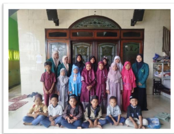
Gambar 5. Dokumentasi Kebersamaan Tim PKM dan Santri TPQ.

Demonstrasi mandiri doa dan gerakan wudhu oleh santri secara bergantian, menunjukkan bahwa metode pembiasaan praktik ibadah secara langsung telah berhasil mentransformasi rutinitas fisik menjadi pengalaman spiritual yang bermakna. Kegiatan ini merupakan bentuk konkret dari ketercapaian tujuan keempat atau tahap define , di mana santri tidak hanya sekadar menghafal tata cara secara teoretis, tetapi telah mampu menginternalisasi nilai kedisiplinan dan kesadaran batin melalui aksi nyata yang dilakukan secara konsisten (Mu'arif et al. , 2025). Melalui pendampingan intensif yang menggabungkan aspek motorik dan pemahaman doa, para santri menunjukkan kemajuan signifikan dalam aspek tanggung jawab moral dan keterhubungan spiritual, sehingga dapat disimpulkan bahwa target internalisasi karakter religius sejak usia dini telah terealisasi dengan optimal sesuai dengan rencana program yang ditetapkan.