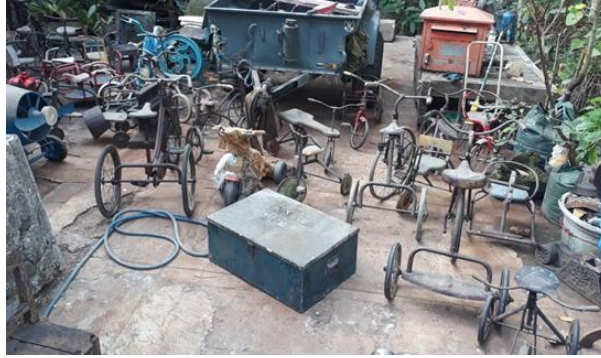
Gambar 1. Dokumentasi memori masa kanak-kanak.