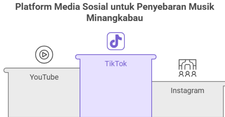
Gambar 4. Platform Media Sosial yang berperan sebagai media.