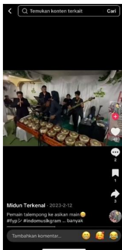
Gambar 3. Tampilan akun TikTok @midunterkenal dengan kolaborasi musik tradisional dan modern.