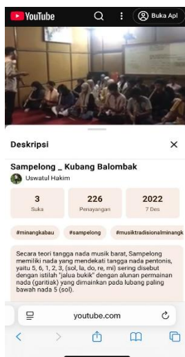
Gambar 2. Tampilan akun YouTube Uswatul Hakim menampilkan video tutorial sampelong. Lebih intrekasi pembelajaran