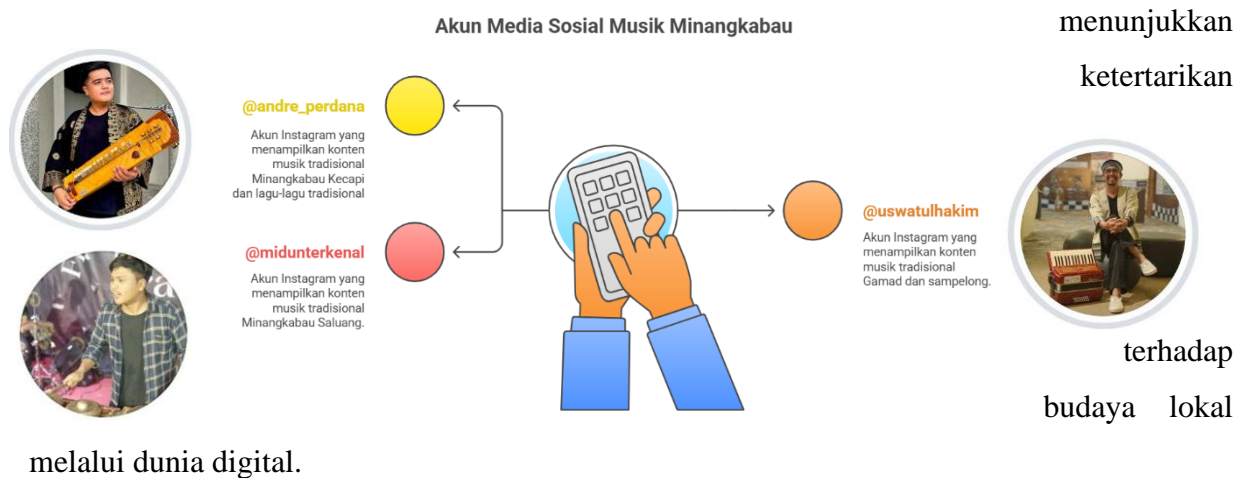
Gambar 6. Akun media sosial yang aktif .

Berdasarkan hasil observasi awal pada tanggal 7 Juli 2025, ditemukan bahwa beberapa akun media sosial aktif menampilkan konten yang berkaitan dengan musik tradisional Minangkabau. Di antaranya adalah akun Instagram @andre_perdana, @uswathakim, dan @midunterkenal. Ketiga akun tersebut secara konsisten mengunggah berbagai bentuk konten musik tradisi, seperti penampilan Saluang , Talempong , Gandang Tambua , serta karya kolaboratif antara musik tradisional dan musik modern. Konten-konten ini tidak hanya berfungsi sebagai hiburan, tetapi juga menjadi media pembelajaran dan sumber referensi bagi banyak pengguna media sosial, khususnya generasi muda di Kota Padang yang mulai