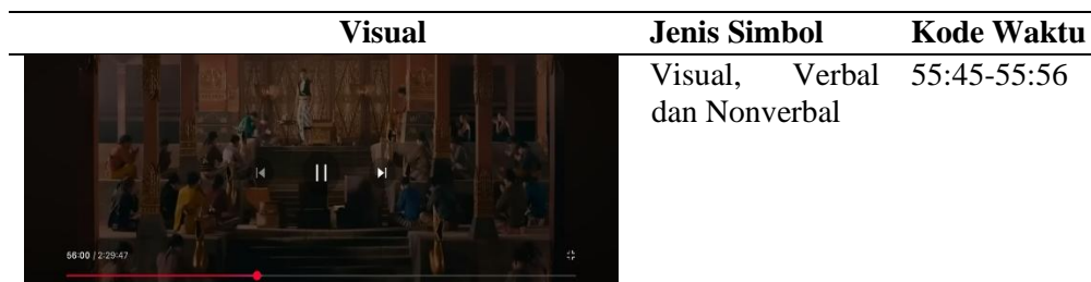
Tabel 4. Scene 4 – Sultan Agung Bersikap Tegas.

Secara denotasi, Tokoh Utama: Sultan Agung (Raden Mas Rangsang muda), masih mengenakan pakaian tradisional yang sama, berdiri tegak di tengah ruangan yang megah. Ia berada di posisi yang lebih tinggi dari para pendengarnya. Pendengar: Para tumenggung, adipati, dan penasihat terlihat duduk bersila di lantai di hadapan Sultan Agung, mengarahkannya pandangan ke arahnya. Postur mereka menunjukkan sikap hormat dan mendengarkan dengan saksama. Latar Belakang Ruangan keraton yang kaya ornamen, memberikan kesan keagungan dan tradisi. Ekspresi Wajah Sultan Agung: Terlihat serius, namun dengan nada yang lebih membakar semangat atau menantang, tidak lagi sekadar memperingatkan. Gestur Mungkin ada gestur tangan yang menguatkan poin yang ia sampaikan, "Orang-orang asing itu bisa berkuasa karna orang-orang seperti kita terlihat lemah dimata mereka." Intonasi suara Sultan Agung terdengar tegas, persuasif, dan mungkin sedikit menantang atau menyindir, mencoba membangkitkan harga diri para pendengarnya.