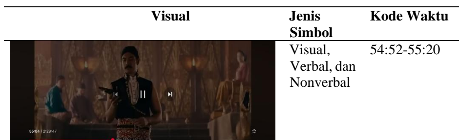
Tabel 3. Scene 3 – Memegang Senjata VOC.

Secara Denotasi Tokoh Utama Sultan Agung (Raden Mas Rangsang muda) berdiri di tengah, menghadap ke arah adipati/penasihat yang duduk di hadapannya. Ia masih mengenakan pakaian tradisional Jawa yang sama. Objek Penting: Sultan Agung memegang erat sebuah pistol kecil (senjata yang kemungkinan diambil dari VOC di adegan sebelumnya) di tangan kanannya, mengarahkannya sedikit ke bawah namun jelas terlihat. Ekspresi Wajah Wajah Sultan Agung terlihat serius, sedikit tegang, dan menunjukkan kekhawatiran atau peringatan. Gestur Gerakan tangannya yang memegang dan mungkin sedikit mengacungkan senjata tersebut. Latar Belakang Masih di dalam ruangan keraton yang megah, dengan para adipati/penasihat duduk di lantai, mendengarkan dengan saksama.