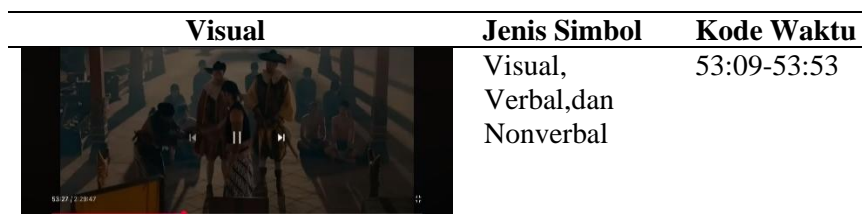
Tabel 2. Scene 2 – 2 Melucuti Senjata Perwakilan VOC.

Secara Denotasi Tokoh Utama: Sultan Agung (Raden Mas Rangsang muda) masih dalam pakaian tradisionalnya, berdiri di tengah ruangan keraton. Tindakan Sultan Agung mengulurkan tangan dan secara fisik mengambil atau memerintahkan untuk mengambil senjata dari perwakilan VOC. Pihak VOC Perwakilan VOC terlihat pasif atau terkejut/bingung saat senjata mereka diambil.