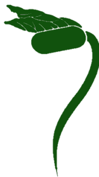
Gambar 5. Logogram taoge

Logogram berbentuk seperti taoge yang tegak menyamping. Plumula dan kotiledon taoge pada logo terpisah tanpa garis yang menyatu. Lekukan seperti huruf S sebagai hipokotil.