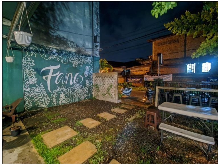
Gambar 3. Fana Coffee