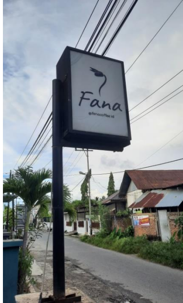
Gambar 1. Logo Fana Coffee

Semiotika Roland Barthes, yang menggunakan konotasi dan denotasi sebagai perangkat analisis, dianggap cocok oleh penulis untuk menganalisis penelitian tersebut. Beberapa uraian dan penjelasan di atas melatarbelakangi alasan penulis untuk mengangkat topik pembahasan dengan judul "Analisis Semiotika Roland Barthes Pada Logo Fana Coffee".