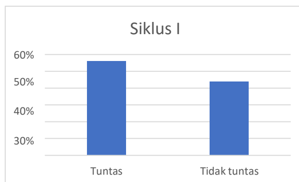
Gambar 1. Hasil Belajar pada Siklus I Menggunakan Posttest

Dari tabel diatas diketahui persentase aktivitas belajar pada siklus 1 cukup baik dengan aktivitas tidak meribu dikelas selama proses pembelajaran 44%, tidak keluar masuk kelas selama pembelajaran berlangsung 98%, aktif bertanya 12%, menjawab pertanyaan 44%, dan bekerjasama dalam kelompok 78%.