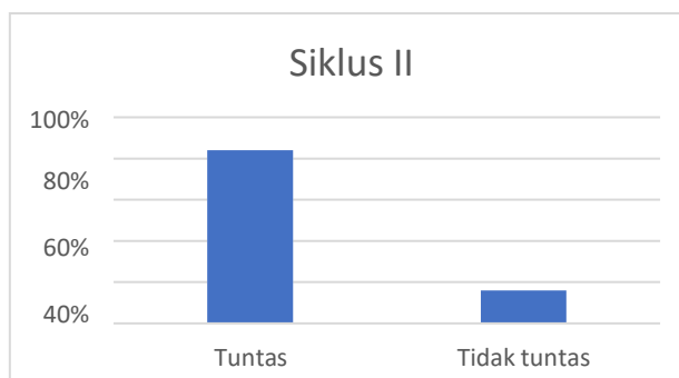
Gambar 3 Hasil Belajar pada Siklus II Menggunakan Posttest

Berdasarkan gambar di atas, selama pembelajaran, dari 25 siswa tidak ada yang ribut di kelas dengan persentase 52%, dan tidak ada yang keluar masuk kelas dengan persentase 100%. Aktivitas bertanya dilakukan oleh 17 siswa dengan persentase 68%, 22 siswa menjawab pertanyaan guru dengan persentase 88%, dan 25 siswa bekerja sama dalam kelompok dengan persentase 100%. Observasi menggunakan model media pembelajaran digital pada siklus II menunjukkan peningkatan dibandingkan siklus I; siswa tidak keluar masuk kelas, tidak ribut, lebih aktif bertanya dan menjawab, serta bekerja sama dengan baik dalam kelompok