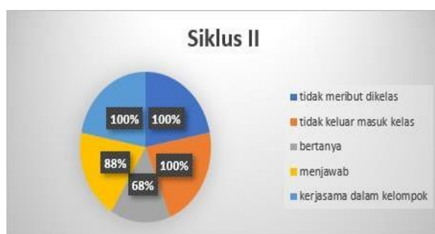
Gambar 2. Grafik Aktivitas Siswa Siklus II

Pada siklus I, pembelajaran seni tari belum optimal karena siswa belum menguasai materi dan hasil tes belum maksimal. Untuk meningkatkan hasil belajar, siklus II akan mempertahankan media pembelajaran digital dan menambahkan refleksi serta tindakan berdasarkan siklus I agar siswa lebih memahami materi.