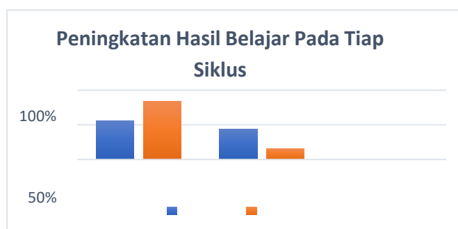
Gambar 5. Peningkatan Hasil Belajar Setiap Siklus

Berdasarkan data yang terkumpul, terdapat peningkatan jumlah murid yang mendapatkan hasil posttest, dengan 14 orang mendapatkan nilai penuh dan 11 orang mendapatkan nilai sebagian. Terdapat empat siswa yang tidak tuntas dan dua puluh satu siswa yang tuntas untuk siklus II. Gambar 15 menunjukkan peningkatan hasil belajar di setiap siklus.