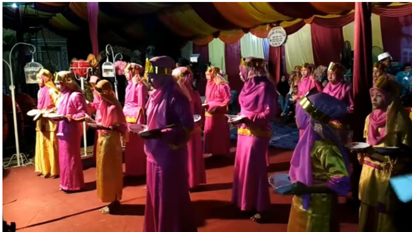
Gambar tari piring grub kalinco yang dibawakan oleh anak sekolah dan acara hiburan