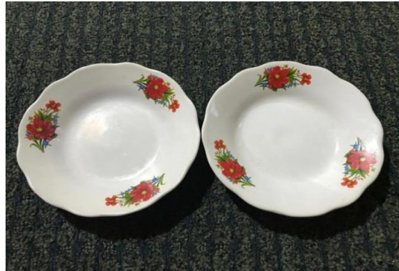
Gambar Properti Tari Piring Grub Kalinco

Properti yang digunakan pada tari piring grub kalinco ini adalah piring yang berukuran 6 inci berikut contoh piring yang digunakan: