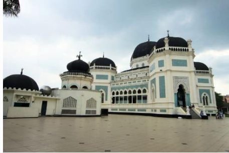
Gambar 4. Halaman dan Tempat Wudhu Masjid Al-Ma'shun Medan

kokoh dengan lengkungan khasnya. Gerbang ini seolah menjadi pintu gerbang menuju sejarah. Di sebelah kiri masjid, terdapat makam Sultan Makmun Al-Rasyid Perkasa Alamsyah IX, pendiri masjid yang megah ini. Keberadaan makam sultan semakin memperkaya nilai sejarah dan spiritual masjid.