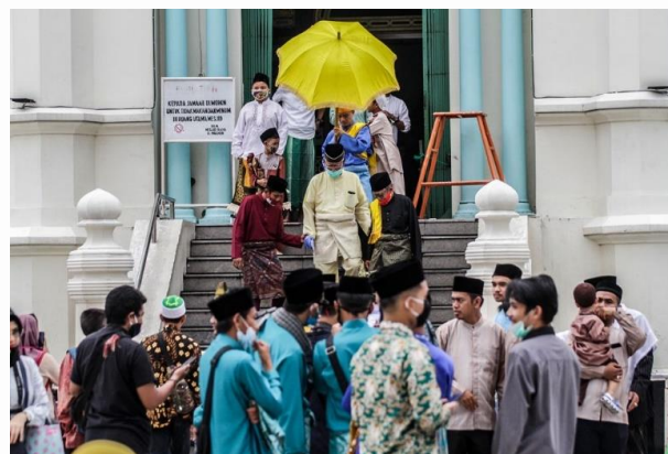
Gambar 7. Sultan Deli beserta keluarga sholat di Mesjid Al-Ma'shun Medan

Sebuah pertanda khas dimulainya sholat Idul Fitri atau Idul Adha di sini adalah kedatangan Tuanku Aji beserta keluarga. Kehadiran beliau yang selalu membawa payung kuning menjadi simbol dimulainya ibadah. Di belakang imam, terdapat batas tali yang menandai area khusus yang diperuntukkan bagi beliau dan keluarga.