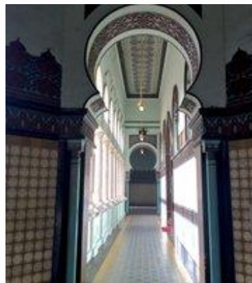
Gambar 3. Koridor Masjid Al-Ma'shun Medan

Koridor-koridor yang mengelilingi ruang utama masjid berperan penting dalam menyatukan keseluruhan desain bangunan. Selain menghubungkan berbagai ruangan, koridor juga memberikan kontribusi pada sirkulasi udara dan pencahayaan alami di dalam masjid. Desainnya yang setengah terbuka menciptakan suasana yang sejuk dan nyaman bagi para Jemaah