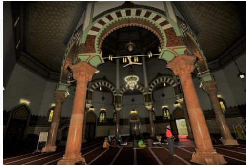
Gambar 2. Ruang Utama & Delapan pilar Masjid Al-Ma'shun Medan

Ruang utama masjid memiliki bentuk segi delapan yang unik, dihiasi dengan kubah besar bergaya Turki yang khas. Dinding-dindingnya dihiasi jendela kaca patri berwarna-warni asal India dan Spanyol, memberikan kesan megah dan mistis. Delapan pilar kokoh dari marmer kuning gading Italia menopang kubah dan menciptakan suasana yang hushed. Setiap pilar dihubungkan oleh lengkungan indah, menambah keindahan arsitektur masjid.