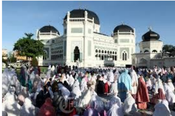
Gambar 6. Sholat Hari Idhul Fitri dan Idhul Adha

Pandemi Covid-19 telah membawa perubahan besar dalam kehidupan kita, termasuk tradisi berbagi bubur sop di Masjid Raya Medan. Demi mencegah penyebaran virus, kegiatan ini terpaksa dihentikan sementara. Namun, begitu situasi membaik, semangat beribadah masyarakat kembali membara. Terbukti pada saat hari raya Idul Fitri dan Idul Adha, Masjid Raya Medan selalu dipadati oleh ribuan jemaah. Mereka datang dari berbagai daerah, bahkan mancanegara, untuk melaksanakan sholat berjamaah. Suasana khushyuk dan meriah begitu terasa saat hari raya di masjid ini