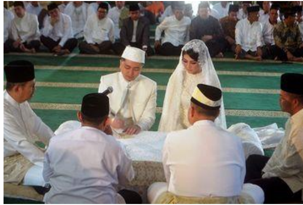
Gambar 8. Prosesi Akad Nikah di Masjid Al-Ma'shun Medan