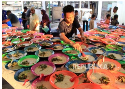
Gambar 5. Pembagian Bubur Sop gratis untuk berbuka puasa

Tradisi berbagi makanan saat bulan Ramadan di Masjid Raya Medan telah mengalami perubahan seiring berjalannya waktu. Awalnya, bubur pedas menjadi hidangan utama, namun kemudian digantikan oleh bubur sop yang lebih sederhana. Meskipun ada perubahan, semangat berbagi dan melestarikan tradisi tetap menjadi hal utama yang ingin dipertahankan. Setiap bulan Ramadan, Masjid Raya Medan menyajikan sekitar 1.000 porsi bubur sop gratis untuk warga sekitar. Sejak menjelang waktu zuhur, masyarakat sudah berdatangan membawa wadah masing-masing. Mereka antusias mengantre untuk mendapatkan semangkuk bubur hangat yang kaya akan rempah dan sayuran. Suasana semakin meriah saat waktu berbuka puasa semakin dekat, dan banyak yang rela mengantre panjang demi menikmati bubur sop khas Masjid Raya Medan.