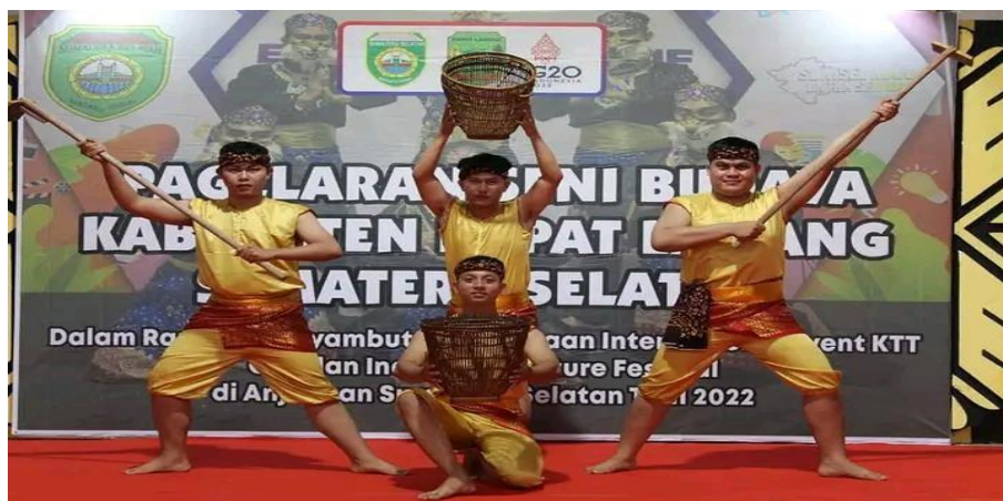
Gambar Pagelaran Seni Budaya Kabupaten Empat Lawang

Sanggar ini dikenal luas atas prestasi dan perannya dalam pengembangan tari tradisional dan kreasi di kawasan Empat Lawang. Ia telah memenangkan banyak penghargaan regional dan nasional Tahun 2021 Tari Ngampagh Kawo Festival Rentak Batanghari Sembilan, 2022 Tari Kujor Benyowo Festival Sriwijaya, 2023 Juara 2 Festival Saling Keruani Sengi Kerawati Tari Maksumay dan lainnya.