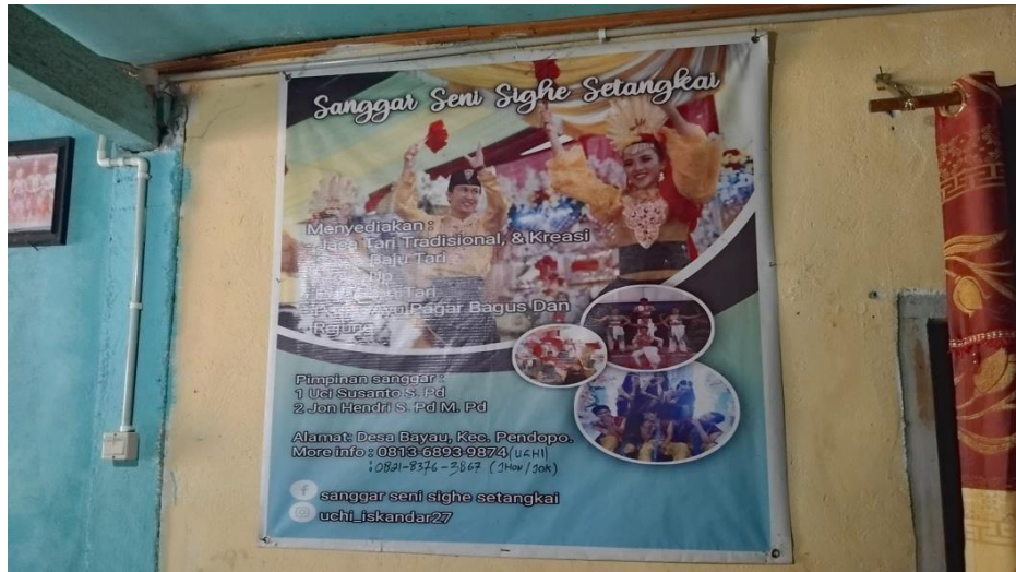
Gambar Sanggar Sighe Setangkai Tempat Pusat Kegiatan