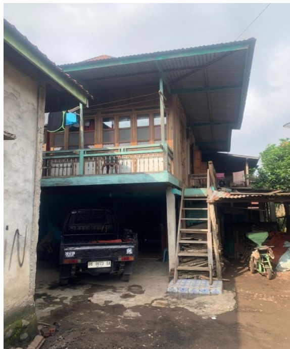
Gambar. Rumah Pemilik Sanggar Sighe Setangkai Bapak Uci Susanto

Area kegiatan Sanggar Seni Sighe Setangkai terdiri dari beberapa ruangan, antara lain ruang utama tempat berlangsungnya proses latihan tari, ruang kostum, ruang tatarias, serta ruang kostum dan alat peraga.