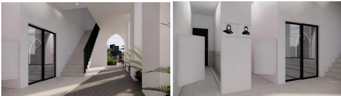
Gambar 2. Perspektif Tangga & Sirkulasi Masjid Joko Agung Purnomo, Lembang.

Alur pergerakan pengguna ditata dengan memisahkan jalur laki-laki dan perempuan sejak dari area gerbang utama. Jemaah pria memiliki akses langsung ke ruang salat utama di lantai 1, sedangkan jemaah wanita diarahkan ke jalur khusus menuju tempat wudu dan area salat yang telah ditentukan. Posisi tangga utama sangat strategis, mudah dijangkau dari dalam ruang ibadah maupun teras selasar, sehingga sirkulasi menuju lantai 2 tidak mengganggu jemaah yang sedang beribadah di lantai 1. Tangga ini juga didesain ramah pengguna (terutama lansia dan anak-anak) dengan ukuran pijakan yang proporsional dan pegangan yang kokoh. Teras selasar yang mengitari bangunan berfungsi ganda sebagai zona transisi sekaligus cadangan area salat saat terjadi lonjakan jemaah pada momen tertentu (salat Jumat atau hari raya). Fleksibilitas ini menunjukkan efisiensi tata ruang dalam merespons fluktuasi kapasitas pengguna tanpa harus menambah luasan bangunan secara permanen (Hildayanti & Wasilah, 2023).