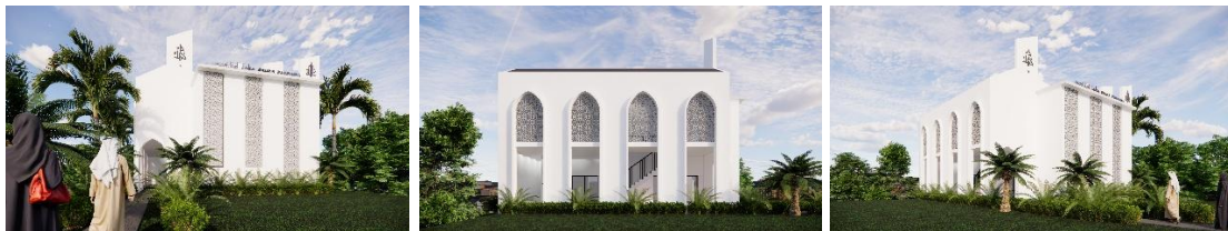
Gambar 5. Perspektif Eksterior Masjid Joko Agung Purnomo, Lembang.

Tampilan eksterior masjid mempresentasikan gaya arsitektur Islam kontemporer yang sukses memadukan kesederhanaan proporsi modern dengan kekayaan ornamen Islam. Karakter paling dominan terlihat pada deretan bukaan berbusur lancip ( pointed arch ) yang lekat dengan arsitektur Gothic-Islamic . Isian bukaan tersebut menggunakan mashrabiyya bermotif bintang delapan ( eight-pointed star ) dengan modul dimensi 49,8 cm, menghasilkan proporsi grid yang sangat harmonis. Selain indah secara visual, motif ini menyimbolkan filosofi kesempurnaan kosmis dalam ciptaan Ilahi (Firdha & Amin, 2021). Elemen vertikal (menara) di bagian muka disederhanakan dari bentuk tradisionalnya, namun tetap efektif berfungsi sebagai penanda monumentalitas bangunan. Hadirnya aksent kaligrafi Arab di area tersebut semakin menonjolkan identitas keislaman.