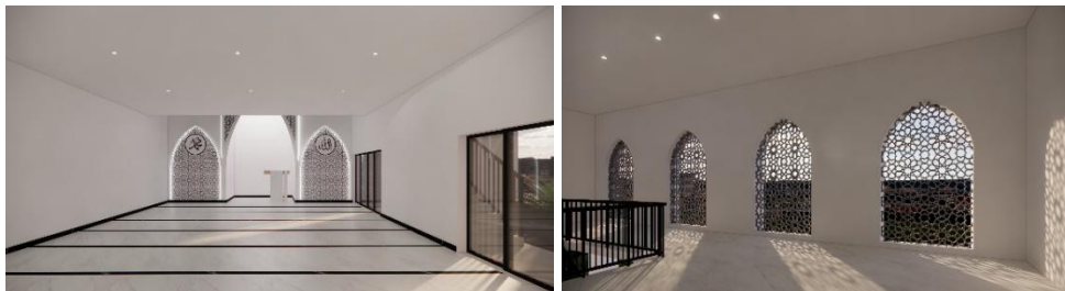
Gambar 3. Interior Ruang Masjid Joko Agung Purnomo, Lembang.

Optimalisasi pencahayaan alami dicapai melalui dua elemen kunci: aplikasi void tengah dan penggunaan bukaan melengkung bermotif mashrabiyya . Bukaan lateral ini didesain cukup masif dengan tinggi sekitar 2,76 meter. Dengan dimensi tersebut, rasio luas bukaan terhadap luas lantai berhasil memenuhi standar pencahayaan SNI 03-2396-2001 untuk bangunan ibadah (sekitar 10 - 15%). Pola geometris mashrabiyya pada bukaan bertindak sebagai pembias cahaya ( diffuser ), mengubah sinar matahari langsung menjadi pendaran cahaya yang merata dan tidak menyilaukan. Inovasi void yang menembus dari lantai dasar hingga ke atap memastikan cahaya menjangkau area terdalam bangunan. Sejalan dengan riset Bagasi et al. (2021), keberadaan void pada sarana ibadah terbukti mampu meningkatkan intensitas pencahayaan alami hingga 40 - 60%.